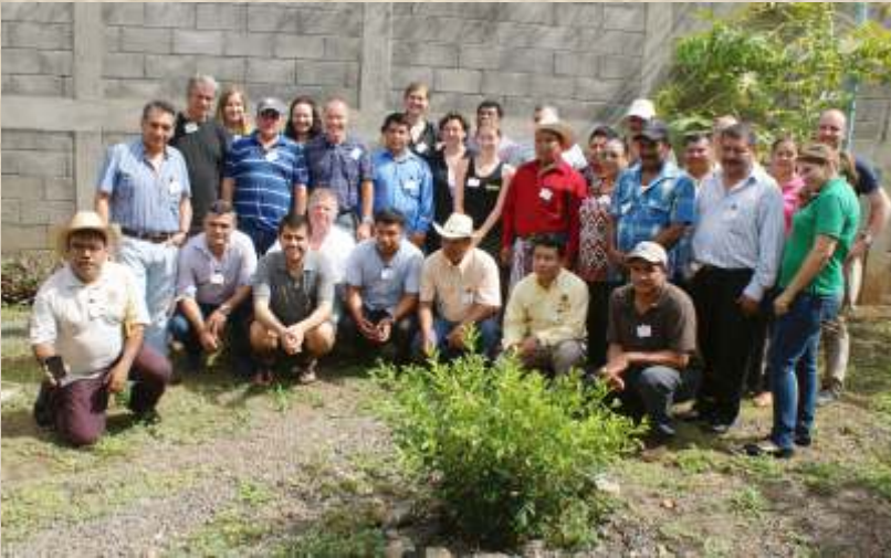
Treffen von Kooperativenvertretern und Fairtrade-Händlern im Sommer 2015 in Managua