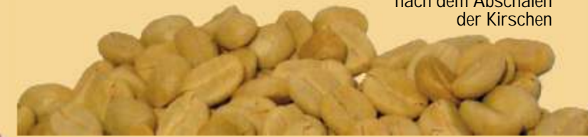
„Café Pergamino“ nennt man die Kaffeebohnen nach dem Abschälen der Kirschen

Wir alle haben Vorteile von einer Kooperative. Die Kommerziellen kaufen den Kaffee und das war's dann. In der Kooperative gibt es andere Ideale, sie hilft uns und wir helfen ihr, das ist das Prinzip. Wir haben eine neue handbetriebene Kaffeeschälmaschine bekommen, einen Mineralien-Zusatz für den Bio-Dünger und so weiter. Jetzt hat uns die UCPCO mit den Schulmaterialien für die Kinder geholfen. Für uns ist das eine große Unterstützung.