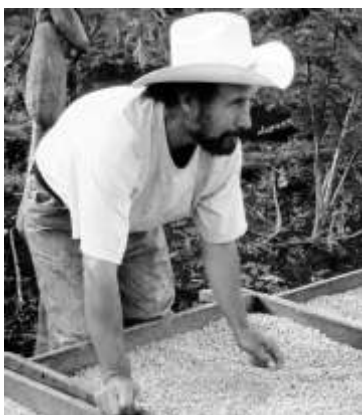
Kaffeeernte wird getrocknet und vorsortiert

Allerdings kann sich dies auch schnell ändern, die spekulativen Rohstoffkurse können genauso schnell wieder einbrechen. Für die Bauern und ihre Familien ist ein dauerhaft höherer Preis, wie ihn der Partnerschaftskaffee zahlt, eine viel verlässlichere Basis für ihr Leben und Arbeiten.