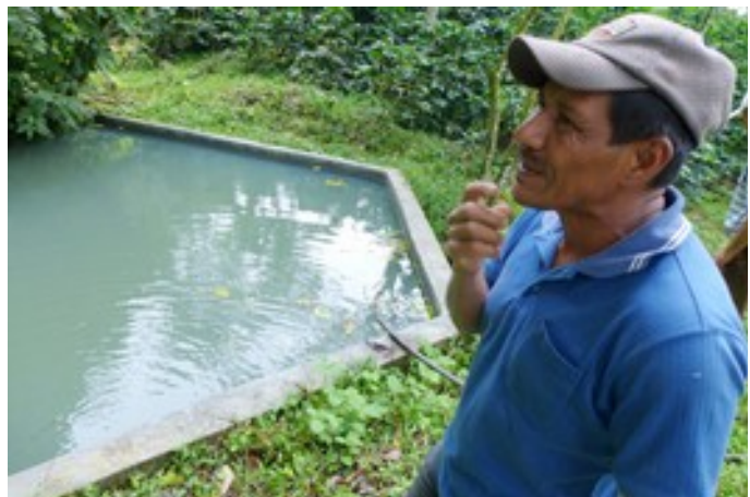
Klimaprojekt - Wasserspeicher für Kleinbauern der Coop. La Providencia